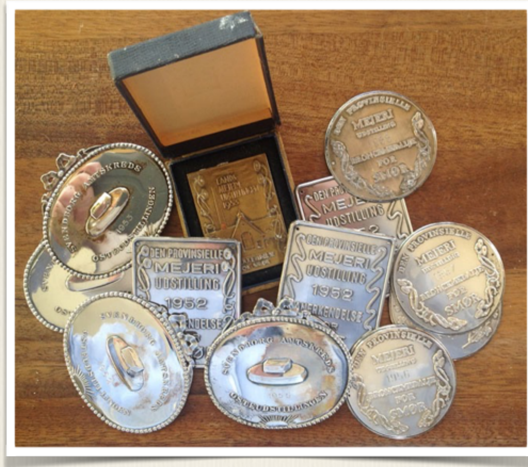
Nogle af fars mange medaljer for ost og smør.