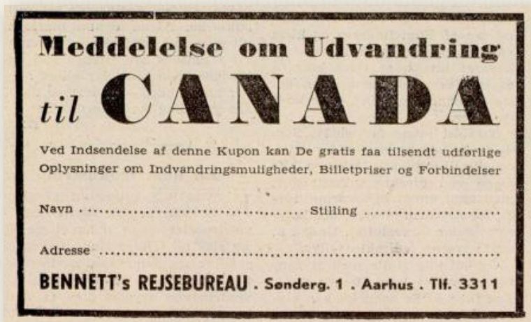
Annonce fra Samvirke i 1951.

Mange danskere, især unge mennesker, udvandrede i 1950'erne til især USA og Canada, fordi arbejdsløsheden var stor i Danmark.