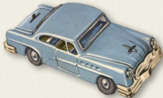
Elektrisk bil - julekataloget fra Sommers Magasin 1957.