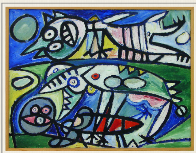
Fru Andersens maleri.