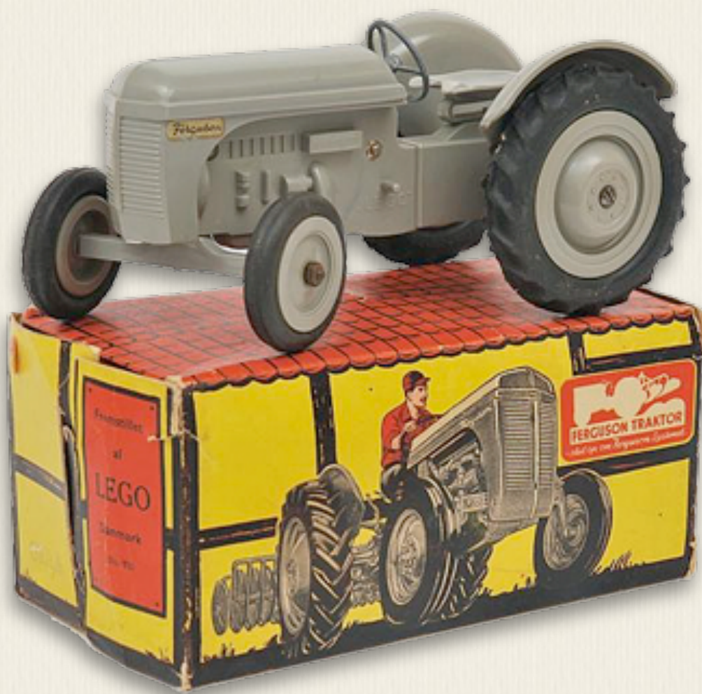
Den lille grå Ferguson jeg så inderligt ønskede mig i julegave.