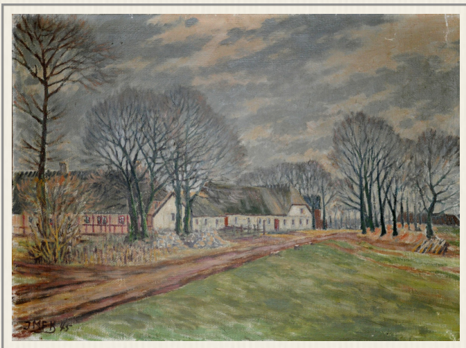
Fars maleri af hans fødegård.