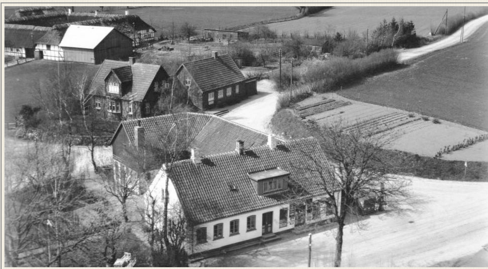
Forrest købmandsbutikken hvor mor aldrig handlede. Bagved forskolen.