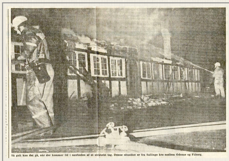
Så galt kan det gå, når der kommer ild i nærheden af et stråtekt tag. Denne situation er fra Sallinge kro mellem Odense og Fåborg.